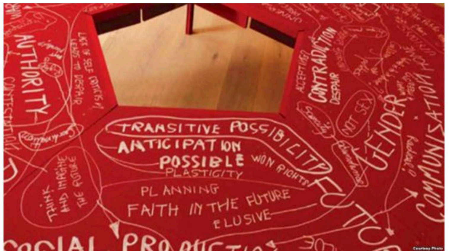
Нада Прља / 58. Венециско биенале / „Субверзија во црвено“

Куратор на Биеналето е Ралф Ругоф, а генералната тема на манифестацијата гласи: „Да живееш во интересни времиња“.